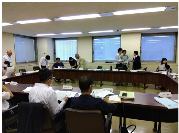
実行委員会：現地視察先をコースごとに検討

本協会に未加入の市町の認定農業者組織を個別に訪問し、ミニサミット中部大会への参加の呼びかけと併せて、本協会への加入を要請します。