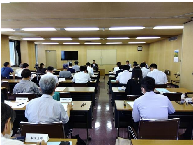
第 20 回総会